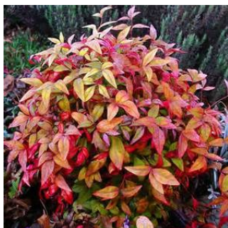
Commandes groupées d'arbustes de haie et d'arbres fruitiers

Vous pouvez adresser votre demande au PNR avant le 28 octobre 2016 (imprimés en mairie) ou au printemps 2017.